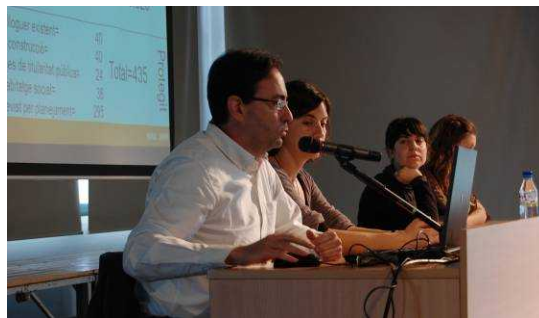
Presentació a càrrec de GMG