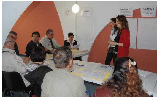
Desenvolupament del taller