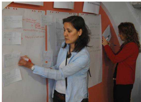
Recollint aportacions i les propostes