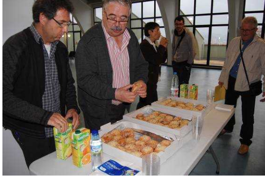
Al final una estona de relaxació