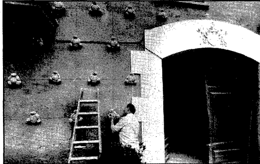
Els pans van començar ahir a prendre possessió de la façana de la Torre Galatea.

Una de les preocupacions que han sorgit a l'hora d'adequar la Torre Galatea per a Dalí, ha estat la de procurar que es respecti la intimitat del pintor que, atesa la situació de les cambres, es podria veure alterada per la gent que viu a les cases veïnes, o pels curiosos. Amb aquest motiu s'ha pensat en dues solucions, l'una seria posar uns xiprers en el jardí de la Torre per tancar aquesta visió i l'altra construir un laberint, segons una idea del propi Dalí, a base d'una estructura en forma d'agulles, que compliria també aquesta funció de preservar la intimitat del pintor a les mirades exteriors. Aquesta segona idea podria ser