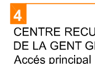
4 CENTRE RECURSOS DE LA GENT GRAN Accés principal