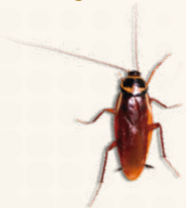
PANEROLA ALEMANYA O ESCARABAT DE CUINA (Blatella germanica)

En cas de necessitar la intervenció d'una empresa especialitzada, assegureu-vos que està inscrita en el Registre Oficial d'Establiments i Serveis Plaguicides (ROESP).