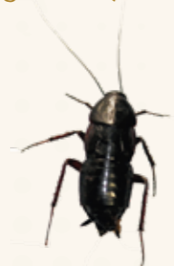
CUCARACHA ORIENTAL (Blatta orientalis)

Se encuentra en lugares cálidos y húmedos (cocinas y baños)