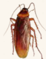
CUCARACHA AMERICANA (Periplaneta americana)

Se encuentra en lugares sombríos y húmedos (bajos, desguaces y alcantarillas).