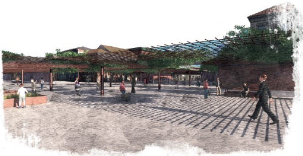
Vista de la Rambla

També es llegeixen les aportacions dels veïns de la primera jornada dels Consells de Barri, que apuntaven a la polivalència de l'espai, per garantir-ne un ús més intensiu però també per adreçar-ho a diferents edats: nens, joves, adults, gent gran.